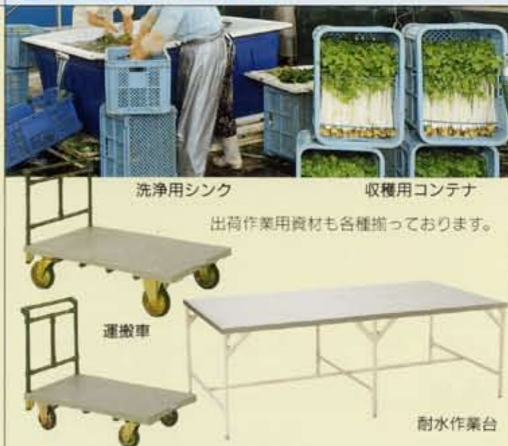
洗浄用シンク 収穫用コンテナ 出荷作業用資材も各種揃っております。