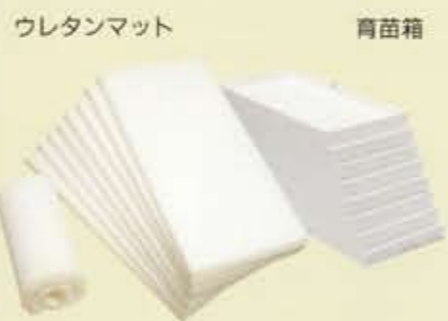
ウレタンマット 育苗箱

ウレタンマットと合わせて、水耕栽培の育苗専用に作られた育苗箱です。材料は軽くて断熱性にすぐれた発泡スチロール製です。ウレタンマットは、ミツバ用・ネギ用・サラダ菜用・ホウレンソウ用等各種取り揃えています。