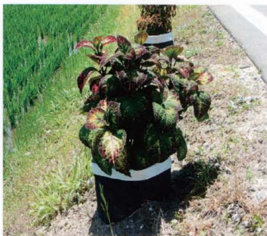
コリウスによる道路美化

袋の表面より水分が蒸発する気化熱 により、夏は2~3℃地温が下がり生 育がよくなります