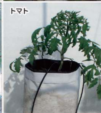
システムイメージ例