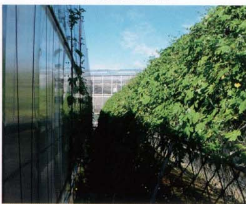
ニガウリによる壁面緑化