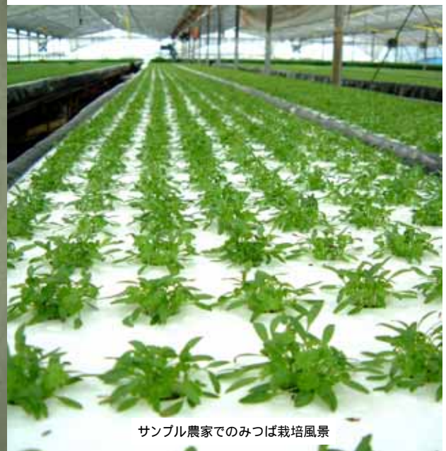
サンプル農家でのみつば栽培風景