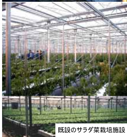
既設のサラダ菜栽培施設